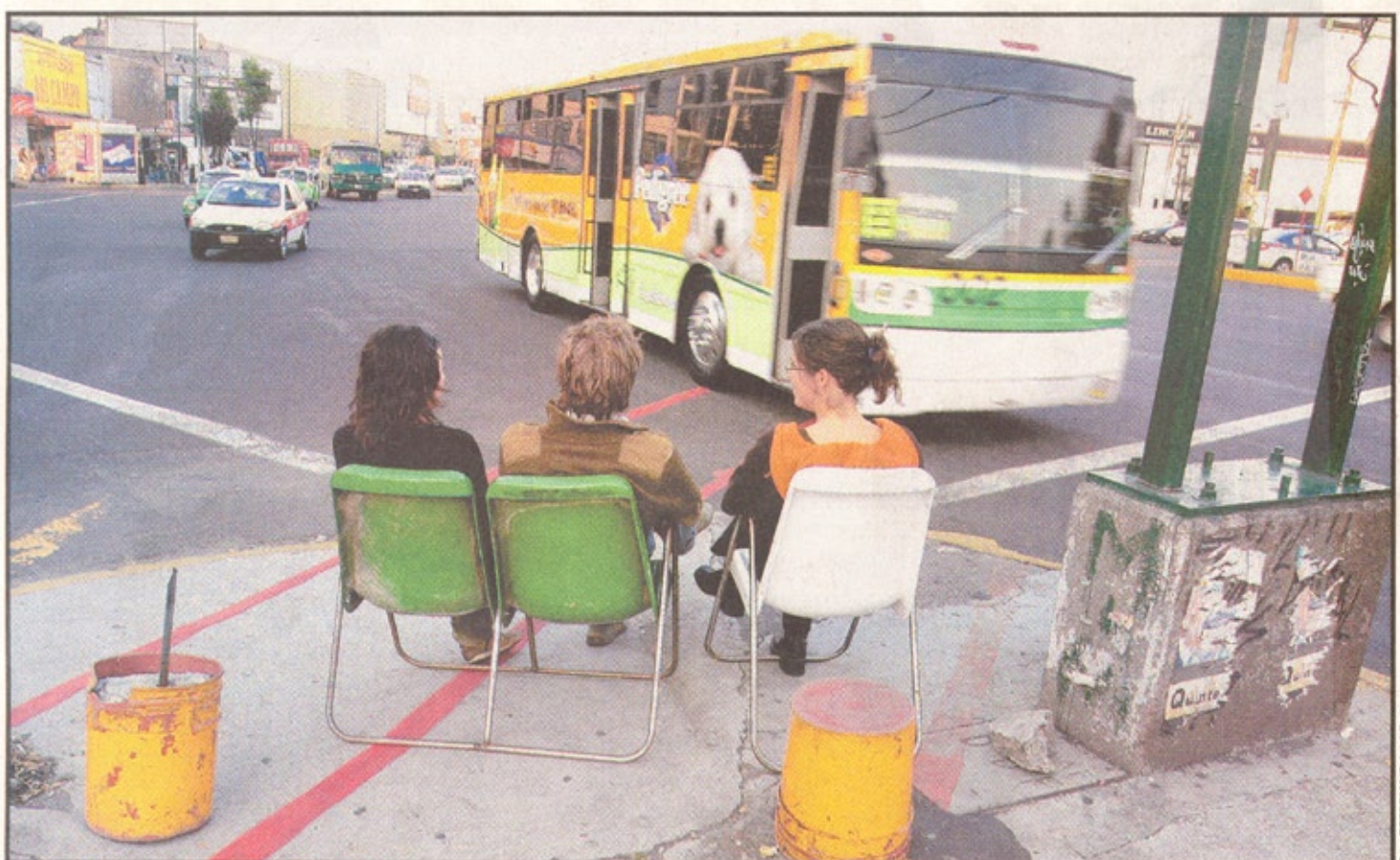
UN CINE INMENSO La esquina de Revolución, Jalisco y Benjamín Franklin es una pantalla de cine en 3D. "Tercera llamada, tercera, principiamos: Aquí viene el tren de los hermanos Lumière...", se lee.